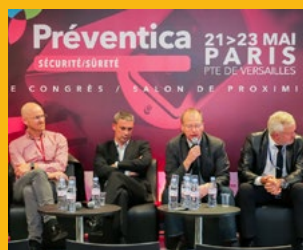
Préventica Paris du 30 nov. au 2 déc. 2021 Porte de Versailles