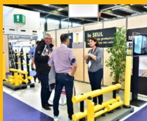
Préventica Lyon du 22 au 24 juin 2021 Eurexpo Lyon