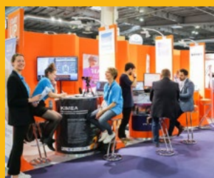
Préventica Nord France du 28 au 30 sept. 2021 Lille Grand Palais