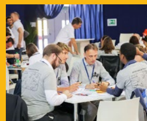
Préventica Toulouse/Sud-Ouest du 18 au 20 jan. 2022 Toulouse parc des expositions